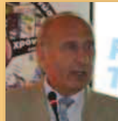
κ. Μωυσιάδης Ιωάννης Αντιπεριφερειάρχης Σερρών