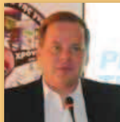
κ. Κων/νος Καραμανλής Βουλευτής ΠΕ Σερρών